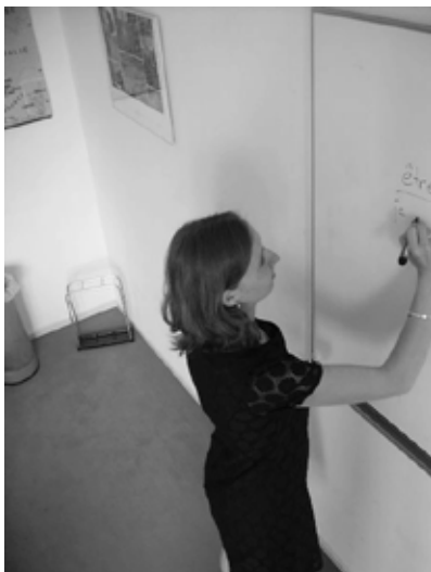
UNE PLONGÉE / Vogelperspektive